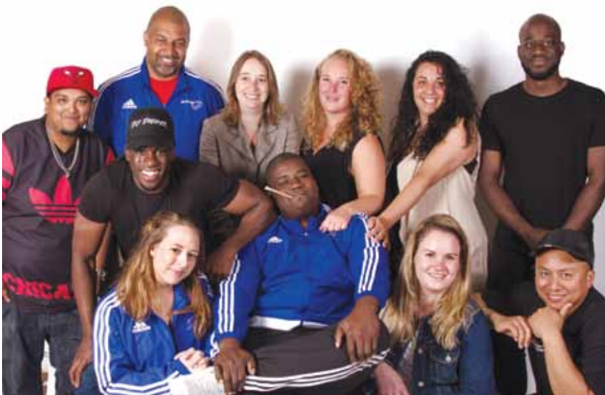
Het team Jongerenwerk zorgt voor participatie op alle niveaus