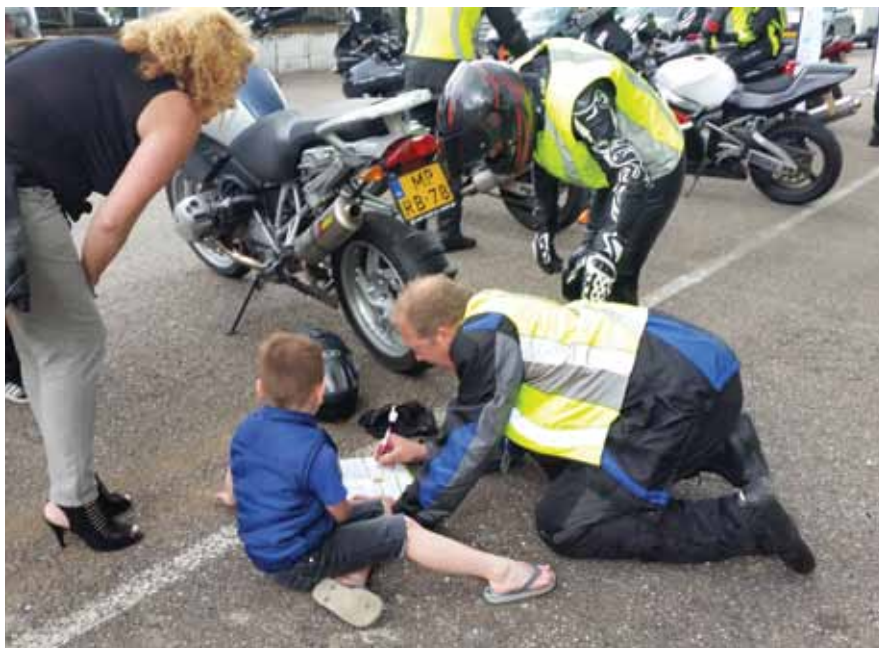
Een jongen wilde graag dat zijn motorrijder in zijn vriendenboekje schreef. Dan zie je dat zo'n 'stoere vent' in motorpak voor het kind door de knieën gaat.

Het project Mooi Zo Goed Zo ondersteunt bewonerswensen en -initiatieven van Almeerders. Dat kan van klein – het regelen van verf voor het schilderen van speeltoestellen – tot groot – het in zelfbeheer nemen van een groenstrook door een bewonerscommissie.