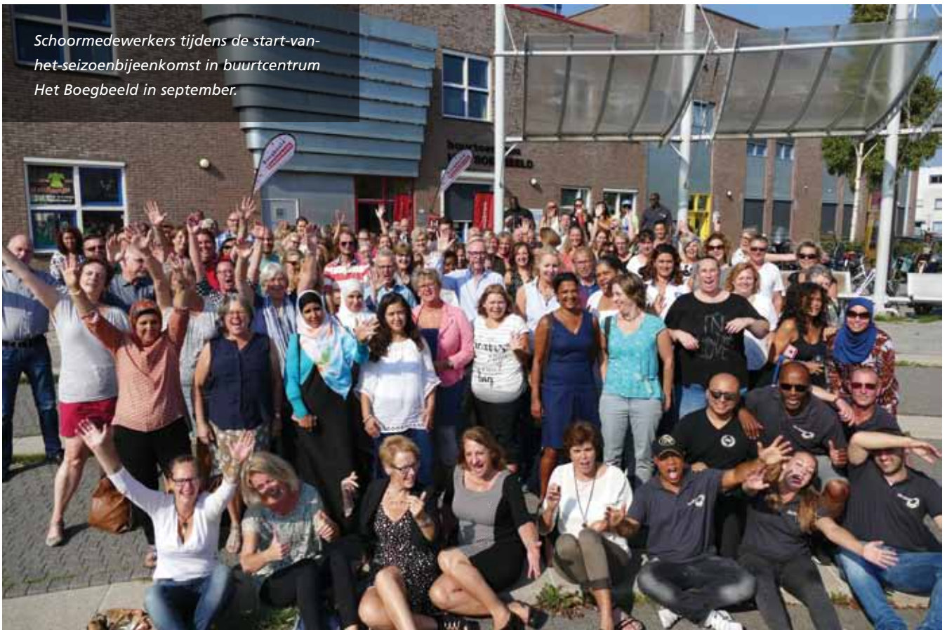
Schoormedewerkers tijdens de start-van-het-seizoenbijeenkomst in buurtcentrum Het Boegbeeld in september.