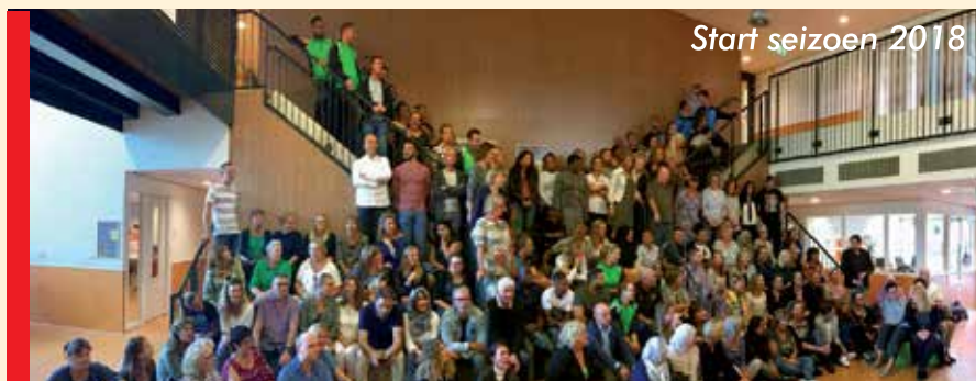
Start seizoen 2018